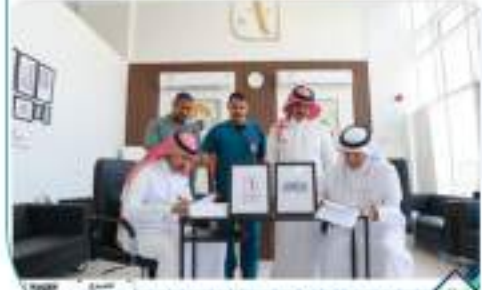
21 مايو 2017 - 11:17 من مساهمة