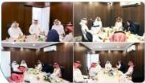
21 مايو 2017 - 11:17 من مساهمة