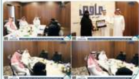
21 مايو 2017 - 11:17 من مساهمة