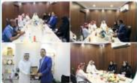
21 مايو 2017 - 11:17 من مساهمة