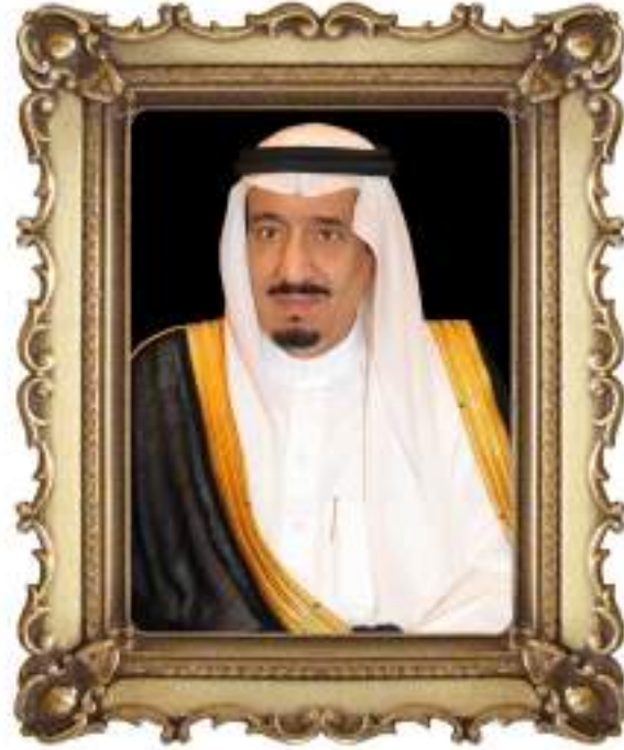
خَادِمُ الْحَرَمَيْنِ الشَّرِيفَيْنِ الْمَلِكُ عَبْدِ الرَّحْمَنِ بْنِ عَبْدِ الْعَزِيزِ السَّعُودِ